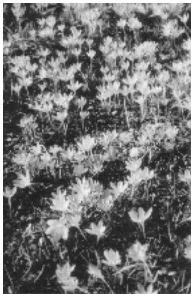
Buschwindröschenblütenteppiche und Krokusse bieten Insekten wichtige Nahrung.

Noch bis Mitte April können wir uns in Wäldern und Auen an den sogenannten Frühblüher, etwa Buschwindröschen ( Anemone nemorosa ), Gelbem Windröschen ( A.ranunculoides ), Scharbockskraut ( Ranunculus ficaria ) und Lerchensporn ( Corydalis-Arten ) erfreuen. Diese und andere Arten entwickeln vor dem Blattaustrieb der Bäume eine üppige Bodenflora. Mancher Buchenwald verwandelt sich durch die Tausenden von weißen Blüten dichter Buschwindröschenbestände wie aus Märchenhand zur „verschneiten Waldlandschaft“, Auenwaldpartien wiederum breiten mit Beständen von Scharbockskraut und Lerchensporn gelbe und rosafarbene Teppiche vor uns aus. Da auch Frühblüher auf ausreichende Lichtmengen angewiesen sind, müssen sie die kurze Zeit bis zur Ausbildung des geschlossenden Waldlaubdaches nutzen. Unterirdische Speicherorgane ermöglichen Ihnen einen schnellen vegetativen Aufbau mit kurzfristiger Blüten-, Samen- und Fruchtbildung. So plötzlich, wie wir das Naturschauspiel „Frühblüher“ erleben durften, so schnell geht es mit dem ebenso wunderbaren Blattaustrieb der Bäume zu Ende – die Pflanzen ziehen ein und erscheinen erst wieder im