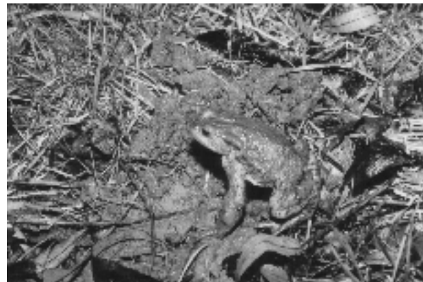
Der Erdkrötenmann hält noch Ausschau, ...

Während die Mauerbienen an ihren Nistplätzen Hochzeit feiern, waren die Hummelköniginnen schon im vergangenen Herbst auf Hochzeitsflug. Nun begegnen wir den überwinterten, dringend Nahrung benötigenden, auffallend großen Hummelköniginnen an Weidenkätzchen und Krokussen. Besonders auffallend ist auch ihr knapp oberhalb der Erdoberfläche erfolgreicher Suchflug nach einer Nistmöglichkeit. Sowie die Königin die ersten Arbeiterinnen im Nest - oftmals einem verlassenen Mäusenest - herangezogen hat, lässt sie diese, bis auf das Eierlegen, alle anderen Arbeiten