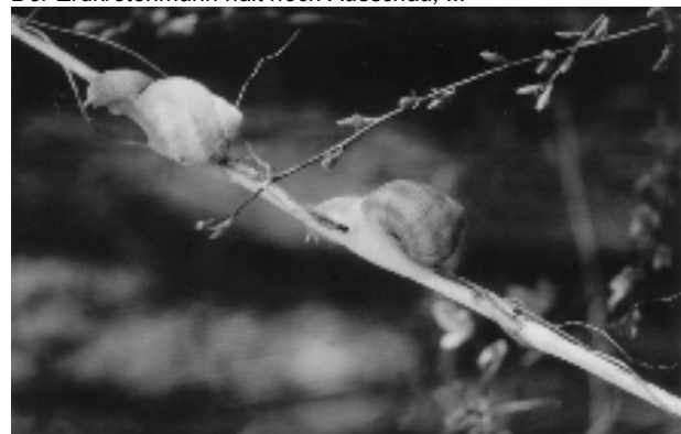
... die Weinbergschnecken werden sich schon finden, und die Mauerbienen haben's geschafft: Bald gibt's Nachwuchs!