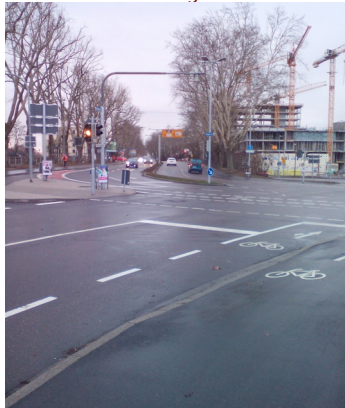
Abb. 2: Kreuzung Ettlinger Straße