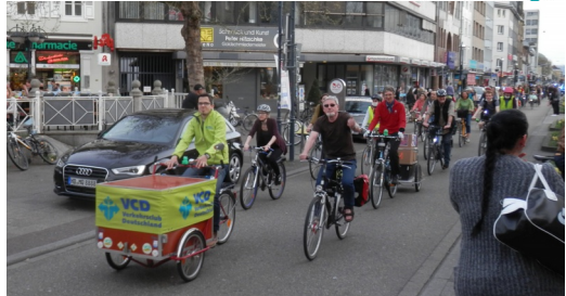
Fast nur Radfahrer auf d. Bild: So geht Verkehrswende! Leider, „nur“ die Critical Mass 3/17