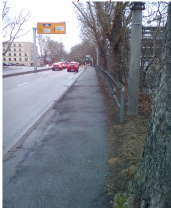
Abb. 3: Schlechte und schmale Wegstrecke

sächlich, wie wir später in einem zweiten Versuch sehen werden. Zunächst folgen wir jedoch der offiziellen Umleitungsstrecke. Diese führt über die erste Ampel und vier Fahrspuren auf den in Abb. 3 gezeigten schmalen und hoppeligen Bürgersteig. Dieser Weg ist ein Ärgernis! Spätestens wenn der neue Busbahnhof in der Fautenbruchstraße gebaut wird und zusätzliche Fußgängerströme auslöst, muss man hier etwas machen. Immerhin hat man kurz vor der nächsten Ampel, an der wir links abbiegen müssen, eine zusätzliche Aufstellfläche geschaffen, wie Abb. 4 zeigt. Leider ist diese Wartefläche auch nötig, denn die Ampeln sind so geschaltet, dass wir hier wieder warten müssen.