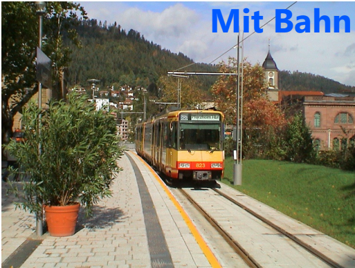
Seit '03 mit der Stadtbahn erreichbar: Kurpark Wildbad

Gerade im Umfeld Karlsruhes und seinen weit ins Hinterland reichenden S-Bahnen empfehlen sich viele erholsame Rad-Touren, mit bequemem Start per ÖPNV.