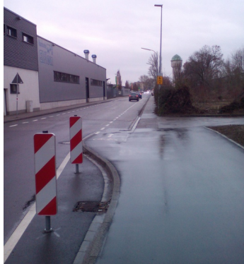
Abb. 1: Neues Radwegende nach Kurve

Wie jetzt weiter? Eigentlich möchten wir auf die linke Seite, denn wir müssen später ja die Schwarzwaldkreuz-Brücke auf der linken Seite passieren. Dies ging auch tat-