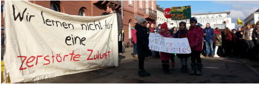
Schülerdemo in KA für Klimaschutz

angesetzt und dürfte angesichts des aktuellen Trends in unserer Gesellschaft, nach dem Flugreisen ohne Rücksicht auf den damit zwangsläufig angerichteten immensen Schaden immer mehr zunehmen, weiter anwachsen. Allein im ersten Halbjahr 2018 stieg die Zahl der Passagiere von deutschen Flughäfen im Vergleich zum Vorjahr um 2,5 %. Für 2019 erwartet die Internationale Luftverkehrs-Vereinigung weltweit sogar einen Zuwachs von 6 %. Auch die Entfernungen der Flüge steigen stetig.