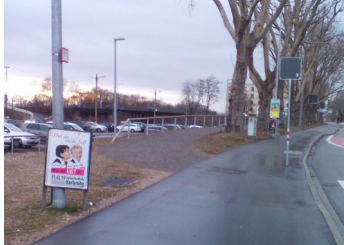
Abb. 6: Alternative neuer Weg links?

Fahrs Spuren (statt sechs), einige Minuten schneller, und – sofern man im Kreuzungsbereich absteigt – auch legal.