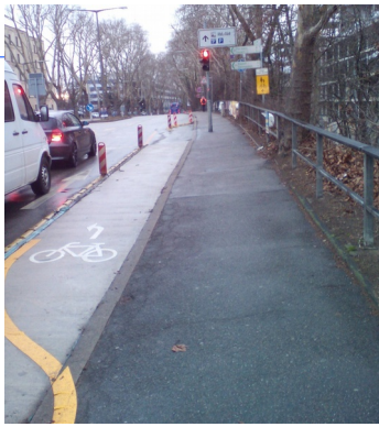
Abb. 4: Aufstellfläche f. Linksabbieger

Wenn wir jetzt auf dem Bürgersteig an der Straße weiterfahren, müssten wir wieder geisterradeln, aber – nanu? – links hinter der Baumreihe ist parallel dazu noch ein neuer geschotterter Weg. Zu welchem Zweck dieser Weg angelegt wurde, ist unklar, aber für uns ist er ideal, denn wir können auf ihm konfliktfrei bis zur Schwarzwaldkreuz-Brücke radeln, ab der es wieder den offiziellen Zweirichtungsradweg gibt. Bilanz: Nur eine Ampel (statt drei), nur drei