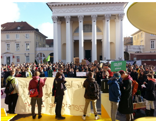
Demo in Karlsruhe;

Stadt Karlsruhe, Amt f. Umwelt- u. Arbeitsschutz