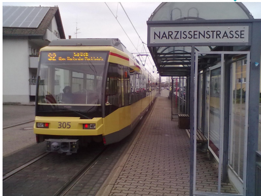
Irgendwann ein Bild aus der Vergangenheit?! AK

PS: Unter ris.geocms.com/rheinstetten finden sich im Ratsinformationssystem am 16.6.2015 Vorschläge zum barrierefreien Umbau noch aller Halte. Einige haben heute schon die richtige Höhe, zumeist fehlen aber Blindenleitstreifen oder teils ausreichende Längen, bei einigen fehlt auch noch die richtige Höhe, nur die Messe ist bereits barrierefrei. Stand 2015 war neben Leitstreifen geplant: Hallenbad: Verlängerung. Hauptstr.: Erhöhung und Verlängerung neu nördlich statt südlich der Hauptstraße. Oberfeldstr.: Verlängerung. Rösselsbrünnele fehlt dort weil Teil des Verfahrens