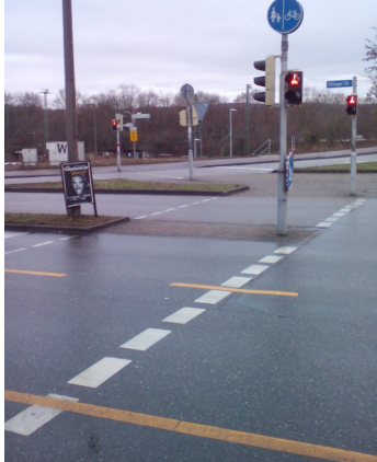
Abb. 5: ... und noch zwei Ampeln ...