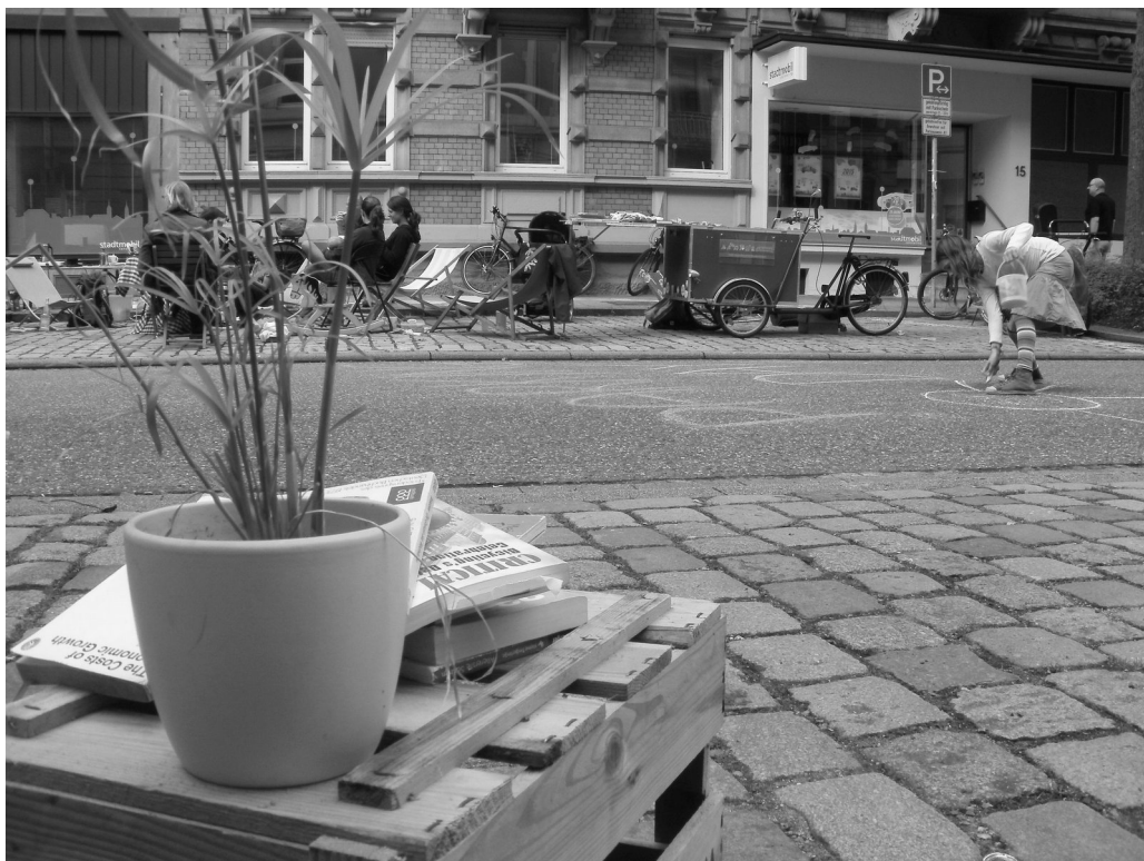
Sitzen, Reden, Lesen, Spielen, Malen, ... Alles, nur nicht Parken!