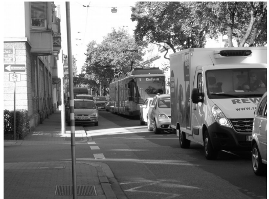
Steckt mit im Stau - die Straßenbahn