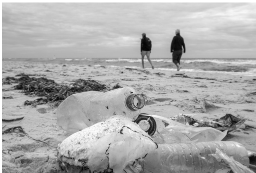
Müll auf dem Darß;

Wir verschwenden Plastik, als wäre es wertlos. Da sich die Katastrophe in internationalen Gewässern zuträgt, fühlt sich keine Regierung dafür zuständig. Also sollten wir Konsumenten möglichst kein oder zumindest weniger Plastik verwenden und so das Müllaufkommen reduzieren. Leider wird es einem nicht einfach gemacht, wenn man z. B. im Supermarkt einkauft. Um Einkaufstüten gibt es viele Fragezeichen. Nur eines ist sicher: Wir müssen unseren Plastiktütenverbrauch dringend reduzieren. Der „Tütengroschen“ an der Kasse sollte auf 50 ct oder 1 € erhöht werden, damit der Verbrauch sinkt. Leider hat der Handel