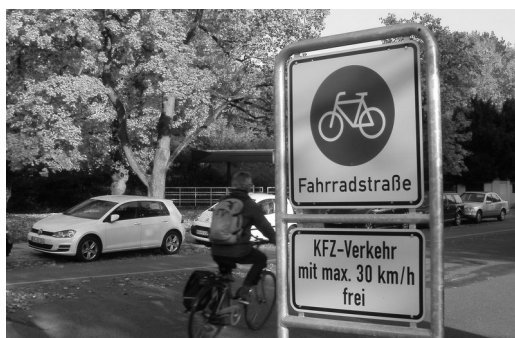
Neue Fahrradstraße Bahnhofstr.