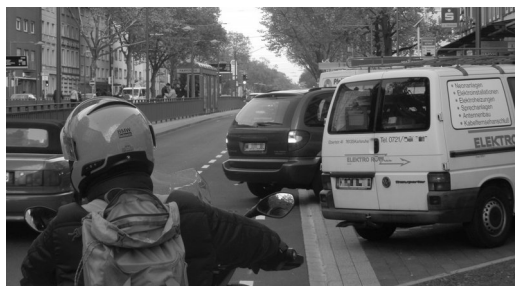
Sicht auf Radler des Schutzstreifens erst dann, wenn man schon voll drauf steht und links nun direkt Autos.

In den letzten Jahren lief in Mühlburg ein Sanierungsprojekt, bei dem auch einige Straßen umgestaltet wurden: die Hardtstr., die komplette Rheinstr. und die Lameystr. samt -platz. Im nördlichen Teil der Rheinstr. und in der Lameystr. wurden untaugliche Radwege durch Schutzstreifen auf der Fahrbahn ersetzt, leider teils zu nahe an Schrägparkern. In der „großen“ Rheinstr. wurde die Haltestelle Philippstr. barrierefrei umgebaut und die Gehwege verbreitert. Beides braucht Platz, die Zahl der Parker wollte man aber nicht einschränken, daher wurden stadtauswärts die Schrägparkbuchten mit ehemals ausreichendem Abstand näher an die Fahrbahn gerückt, die im Querschnitt ca. wie 2007 blieb, während stadteinwärts der Querschnitt reduziert wurde. Bisher konnte man noch den Schutzstreifen (keine Benutzungspflicht) ignorieren und knapp links davon radeln, das Überholen blieb mög-