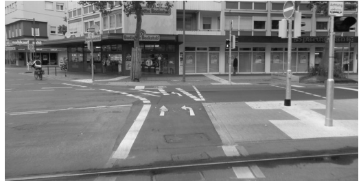
Neu: Linksabbiegen am Entenfang; Fotos: Heiko Jacobs

Tödliche Folgen hatte der Umbau am Lameyplatz. Dort geriet kurz nach Freigabe eine Radfahrerin unter einen abbiegenden Lkw. Man besserte zügig nach und baute eine Insel als Schutz. Ob diese auch geradeausfahrende Radler schützt? Durch eine leichte Linkskurve ergibt sich ein toter Winkel bei