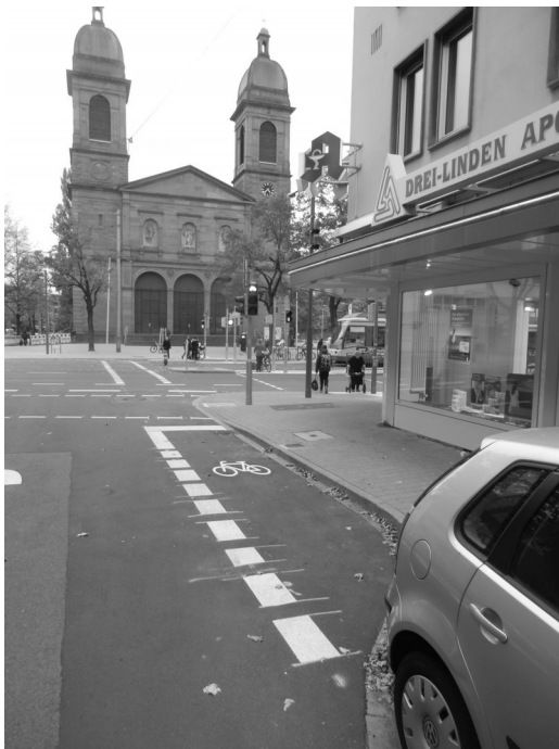
Die bisherige Einbahnstr. Philippstr. in Mühlburg konnte bei der Sanierung dank Umbaus der Ampel für Radler geöffnet werden, mögen die Falschparker davon fernbleiben; Foto: Heiko Jacobs

Wann man im neuen Jahr auf der Schiene wohin kommt, kann man im Bericht über die