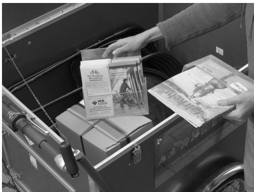
Unser fahrbarer Infostand