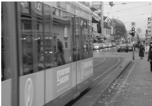
Auch am Stephanplatz ausgebremst, zwar nur eine minimale „Gedenksekunde“, aber in Summe über alle dieser Art kommt „Gezockel“ dabei raus...