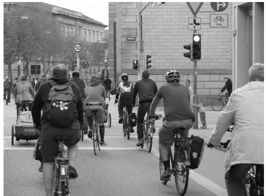
CM – Offensive für das Radfahren

Am Freitag, 27. März um 19 Uhr startete, organisiert von ADFC und VCD, in einem zweiten Anlauf mit circa 150 TeilnehmerInnen die Radfahroffensive Critical Mass (CM). Schon 2011 gab es einen Versuch der Grünen Hochschulgruppe am KIT, den weltweiten Aktionstag für das Radfahren auch in Karlsruhe bekannt zu machen. Der Versuch scheiterte schon nach kurzer Zeit an der kritischen Masse. Diese beginnt ab 16 radfahrenden Teilnehmern. Laut Straßenverkehrsordnung entfällt dann die Radwegebenutzungspflicht, es kann die Fahrbahn benutzt werden, Radfahrende dürfen nebeneinander und im Konvoi