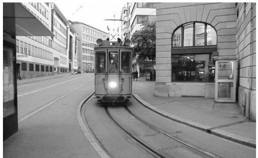
Eine historische Ersatztram statt der bis Jahresende defekten „Dante Schuggi“; Foto: Holger Heidt

wiegend grüne Tramflotte passt sich sehr gut ins Gesamtbild der Stadt ein. Durch die schmalspurigen Gleise sind enge Kurvenradien kein Problem. Außerdem besitzen die neuen längeren Fahrzeuge viele Gelenke. Ein großer Erfolg ist die im Dezember 2014 fer-