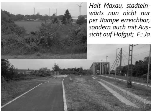
Halt Maxau, stadteinwärts nun nicht nur per Rampe erreichbar, sondern auch mit Aussicht auf Hofgut; F.: Ja

Beschwerde gegen die Subventionierung eines neuen englischen Atomkraftwerks unter www.ews-schoenau.de/kampagne