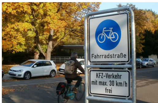
Neue Fahrradstraße Bahnhofstr.; Foto: Mari Däschner